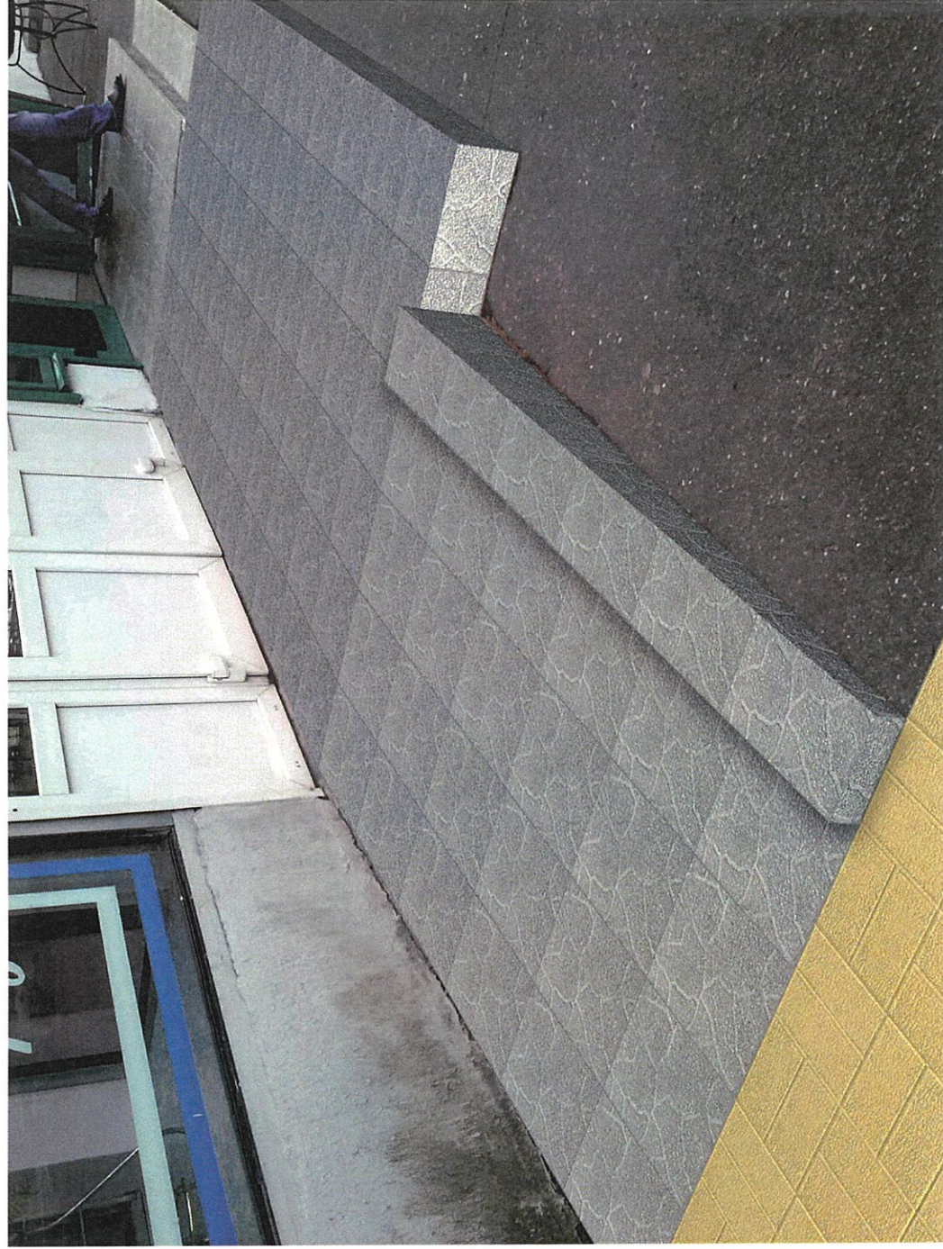
Общий вид крыльца (после реконструкции)